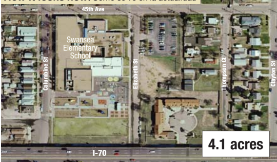
How it looks now / Cómo se ve en la actualidad

Because the Revised Viaduct South Option keeps the highway and 46th Avenue near existing conditions, there will be no upgrades to the school site with that alternative option.