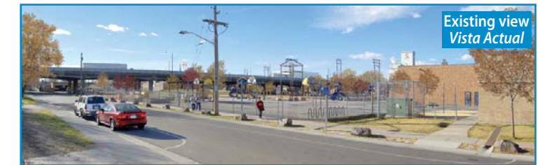
Visual simulation showing possible enhancements to Swansea Elementary School outdoor spaces.