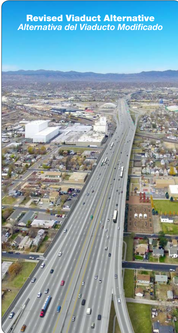
Revised Viaduct Alternative Alternativa del Viaducto Modificado